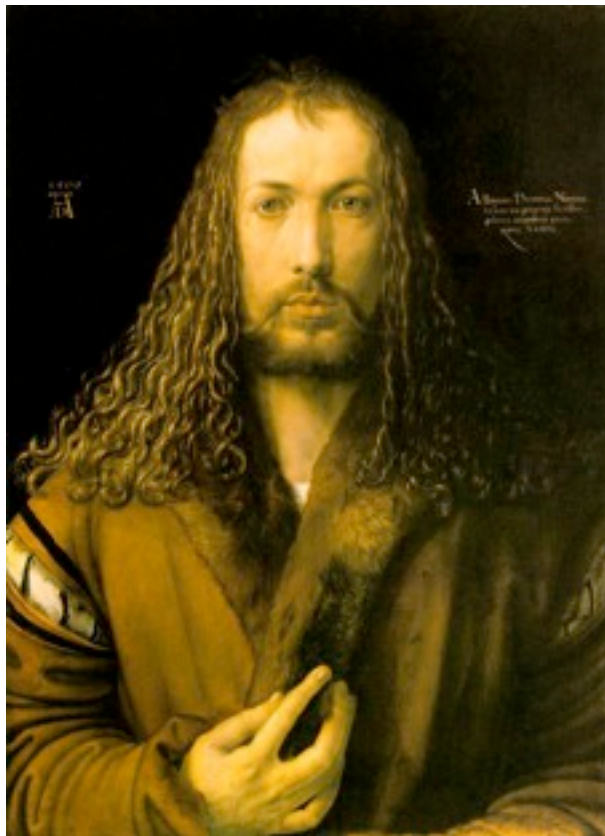
fig.1 – Albrecht Dürer, Auto Retrato aos 28, 1500 Óleo sobre Madeira, 67x49cm, Alte Pinakothek, Munique 24

Ou será o segredo da criação 22 , ou o seu espaço poético 23 , a natureza do objecto artístico? E pode a máquina manipular o segredo da criação? E pode a máquina criar um espaço poético?