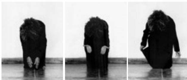
Figuras 9, 10 e 11. Helena Almeida (2005), Da série INTus . Fotografia p/b, 125x90cm, fotografia p/b, 125x90cm e fotografia p/b, 195x90cm.

Desde 1994 (e de forma particularmente grave nas últimas obras: 2003, 2004, 2005) a relação artista/atelier ganha uma dimensão fusional extraordinária. O atelier parece conquistar um papel estruturante no processo de criação e na própria obra de arte. O atelier parece ser simultaneamente o objecto artístico e o acontecimento fundamental da obra.