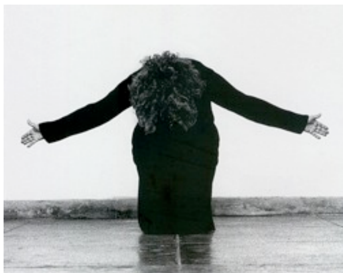
Figura 1. Helena Almeida (2005), Eu Estou Aqui . Fotografia p/b, 125x145cm.

Esta comunicação sedia-se num momento específico do percurso artístico de Helena Almeida. Parte do trabalho 'Eu Estou Aqui' (Figura 1) para apresentar uma reflexão sobre aquilo que parece ser um nó criativo/processual na sua obra: a relação artista/atelier.