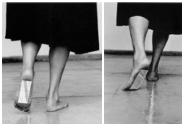
Figuras 4 e 5. Helena Almeida (2000), Da série Dentro de Mim . Fotografia p/b, 103x82,6cm e Fotografia p/b, 103x72cm.