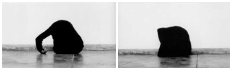
Figuras 6 e 7. Helena Almeida (2003), Da série Sem Título . Fotografias p/b, 129,5x134,5cm.